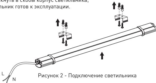
Рисунок 2 - Подключение светильника