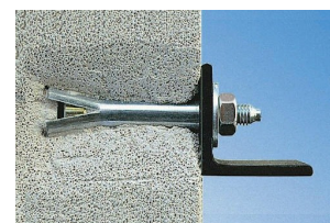
Монтаж анкерных болтов