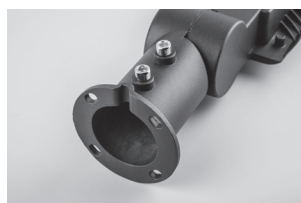
Торшерный монтаж на трубу диаметром 50-55мм