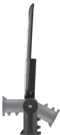
Угол поворота на 90 градусов

Уличные светодиодные светильники с поворотной консолью имеют возможность регулировки угла наклона светильника, что позволяет устанавливать светильники на вертикальные столбы. Светильники мощностью 30 и 50 Вт предназначены для освещения придомовых территорий, дворов, скверов, парков.