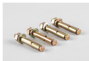
Анкерные болты Ø8мм в комплекте