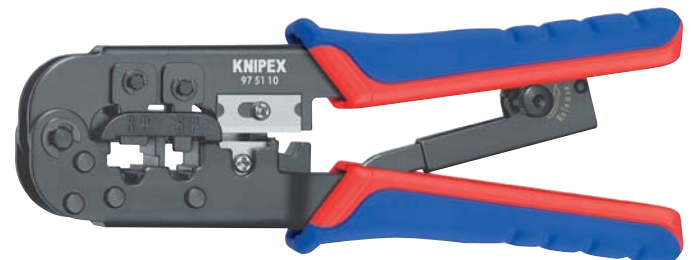
97 51 10