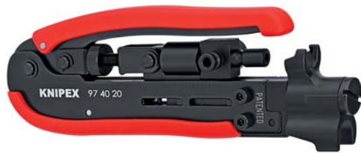
97 40 20 SB