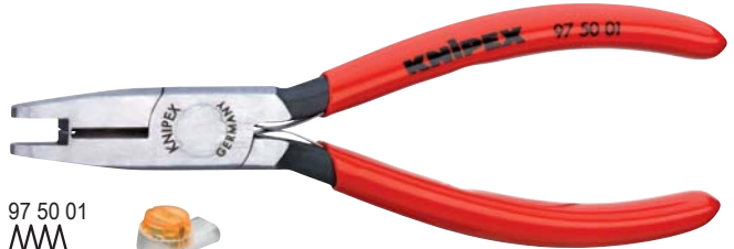
97 50 01