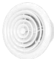
FLOW 4SC BB