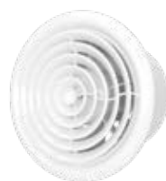
FLOW 5S BB