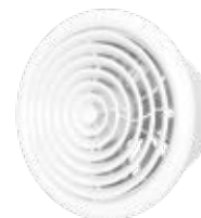
FLOW 6S BB