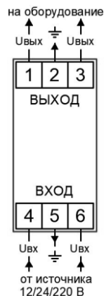
Рисунок 2. Схема подключения