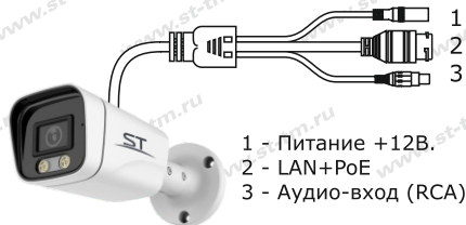
Рис.1 Схема подключения видеокмеры