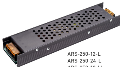
ARS-250-12-L ARS-250-24-L ARS-250-12-L1 ARS-250-24-L1