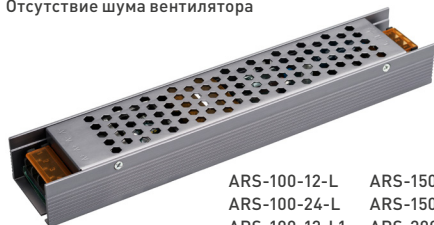
ARS-100-12-L ARS-150-12-L ARS-100-24-L ARS-150-24-L ARS-100-12-L1 ARS-200-12-L ARS-100-24-L1 ARS-200-24-L